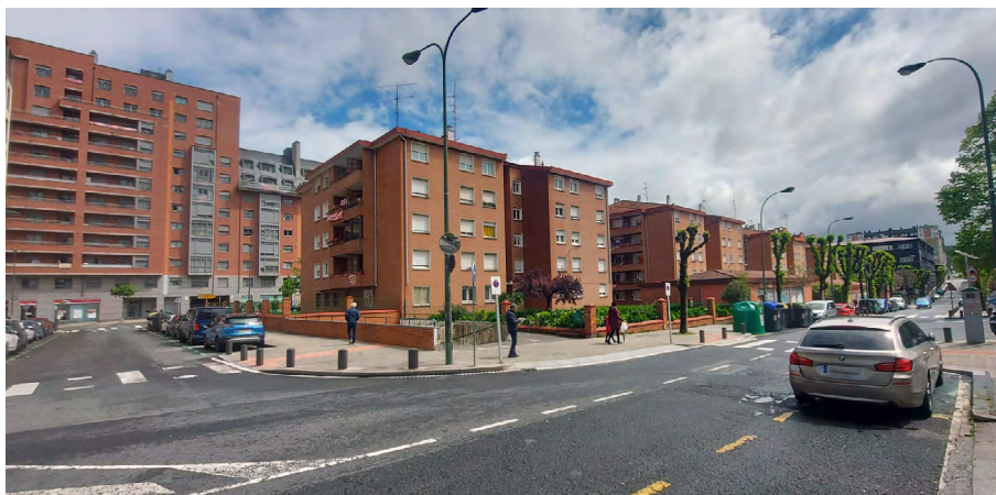
Figura 3. Conjunto de viviendas ubicado en Martín Borua de Picaza nº 13 al 17. © Veronica Benedet, abril 2024.

En una gran parcela con locales comerciales y jardines, se organiza un conjunto de edificios exentos de cinco plantas rematados con cubierta a cuatro aguas de tejas y fachadas de ladrillo visto. (Fig.3)