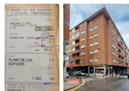
Figura 2. Edificio ubicado en la calle Fika nº 52 (Bilbao). Fuentes: AMB-BUA AYTO 2013-004685 y 5D-83-5917.