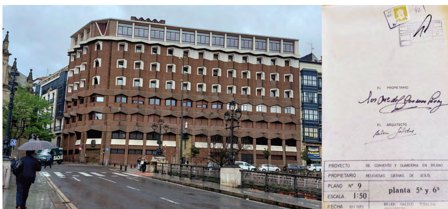
Figura 4. Vista general del convento del instituto religioso Fundadoras Siervas de Jesús de la Caridad e imagen del expediente Fuentes: AMB-BUA AYTO 3D-41-3203.