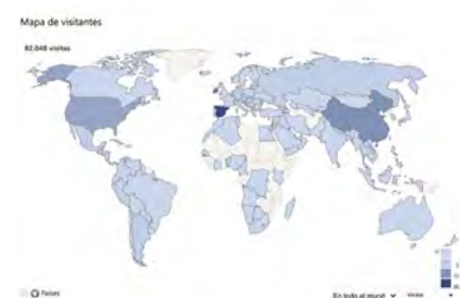
Figura 7. Distribución de las visitas por países, 2023. Fuente propia, datos obtenidos de Google Analytics. © Biblioteca de la ETSA, UPM.

50 Según NEDA-MC (edición 2017), 9. "Las entidades constituyen clases de objetos de la realidad archivística percibidas como categorías claramente diferenciadas que pueden estar reflejadas en los sistemas de descripción archivística de distintas maneras".