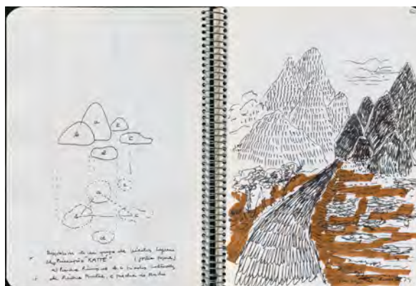
Figura 4. Fondo Fernández Alba. Cuaderno, Viaje a China. © Biblioteca de la E.T.S.A., UPM. Disponible en https://ahdb.upm.es/index.php/cuaderno-016-viaje-a-china-1979 (Última consulta octubre 2024)

Aun así, durante este periodo llegaron importantes donaciones y se realizaron compras, muchas de ellas recomendadas por Fernández Alba o Navascués. La documentación se recibía en la biblioteca o en las cátedras, que la utilizaban para sus lecciones; asimismo, este material siguió difundándose en trabajos de investigación, publicaciones y exposiciones. Años más tarde, Fernández Alba donaría parte de su fondo personal 36 al archivo (Fig.4) y Navascués una colección de dibujos de Arturo Mérida. 37