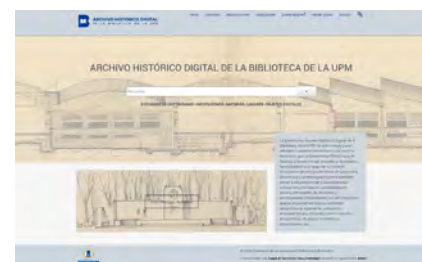
Figura 6. Pantalla de inicio del Archivo Histórico Digital de la Biblioteca.

47 Disponible en https://ahdb.upm.es/index.php (Última consulta octubre 2024)