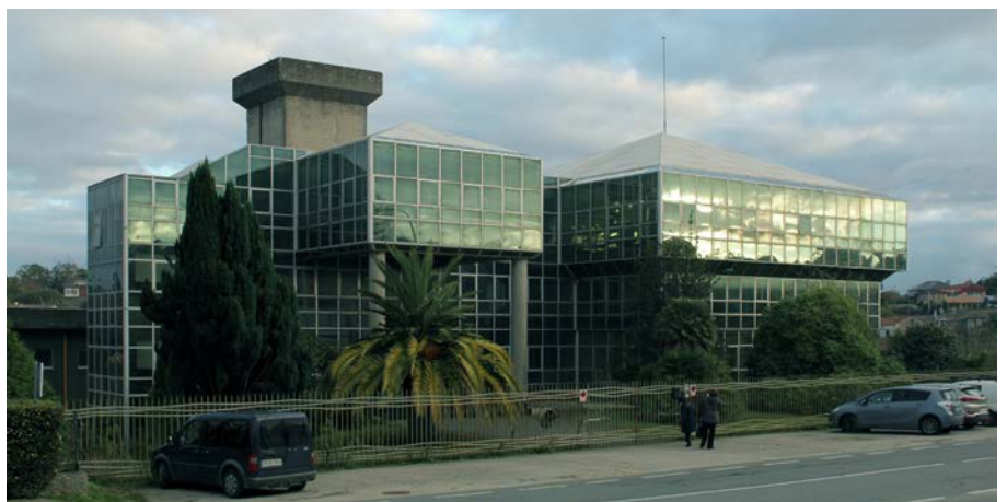
Figura 5. Taller de Joyería de Balcarsa en Bergondo (A Coruña, España).

no hay arquitectos primarios o secundarios, hay arquitectos conocidos o desconocidos, y Severino, era un desconocido.