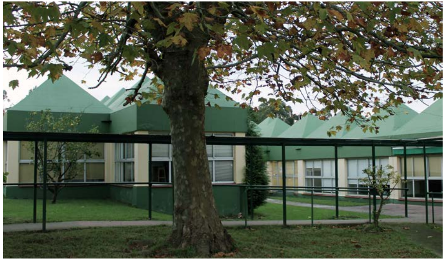
Figura 4. Centro ocupacional y Centro de día Lamastelle en Oleiros (A Coruña, España) Año de Proyecto: 1976 Fin obra: 1979

En ocasiones dialoga con las preexistencias, como muestra con el juego de las escaleras de la torre de Telefónica del Montaña con la Torre de Hércules, o los guiños conceptuales en el taller de Joyería de Balcarsa en Bergondo, con sus cubiertas en punta de diamante (Fig.5).