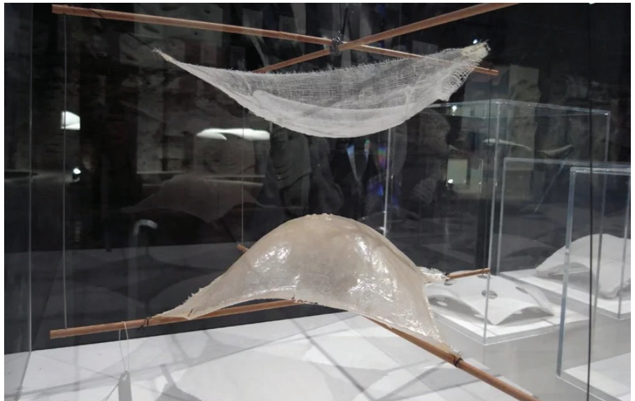
Figura 4. Heinz Isler, modelo paramétrico colgante de tela, madera y cuerda en la Bienal de Venecia: Arum, 2012 © designboom Fuente: https://www.designboom.com/architecture/13th-international-architecture-exhibition-arum-by-zaha-hadid/ (consulta: 31 de mayo de 2019)

19 Thomas S. Kuhn, La estructura de las revoluciones científicas (Madrid: Fondo de cultura económica, 2017), 166.