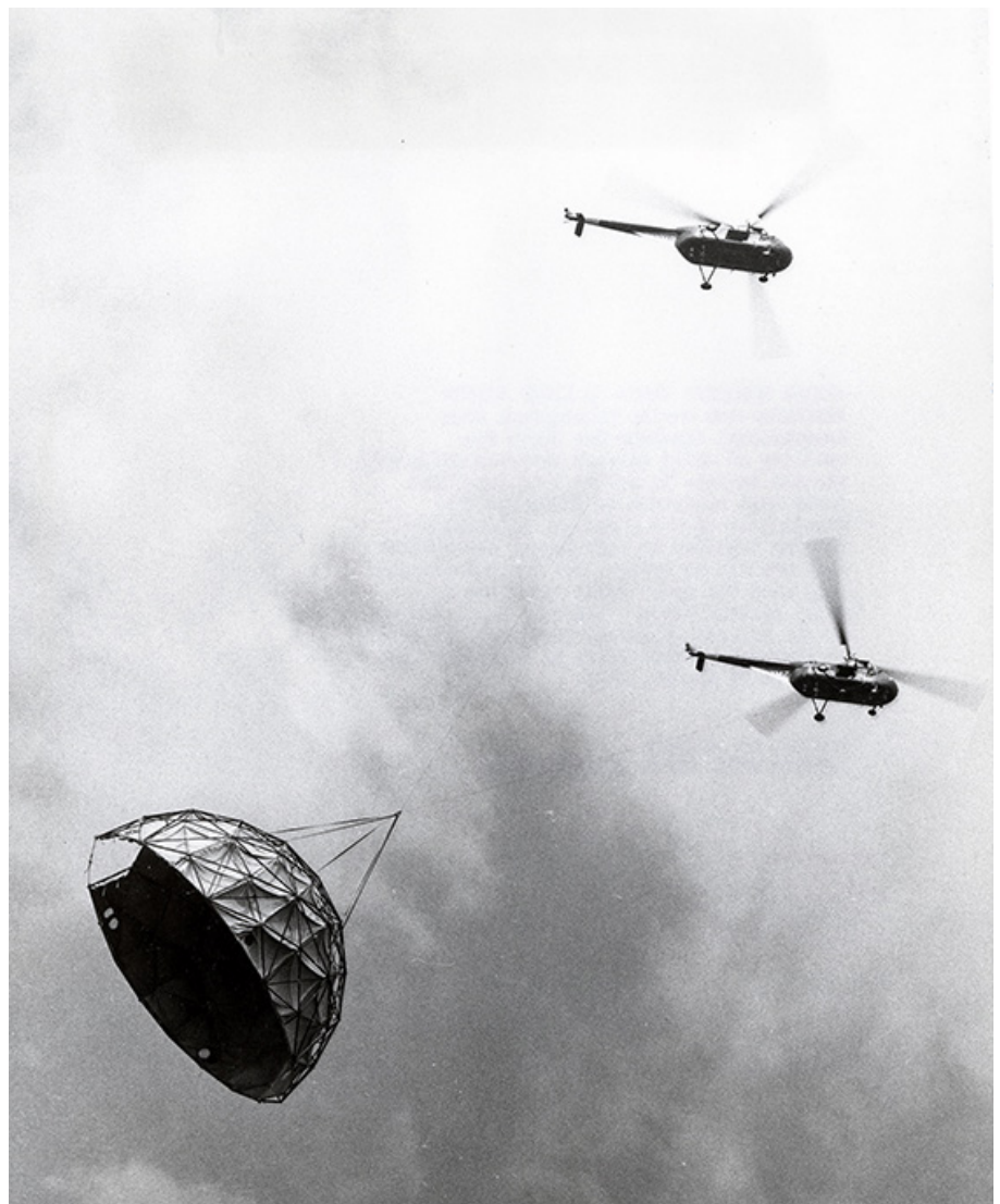
Figura 2a y 2b. Transporte de hangar diseñado por Fuller destinado a albergar tres helicópteros, 1954. Fuente: Naval Institute Photo Archive. https://www.navalhistory.org/2016/01/28/the-marine-corps-goes-geodesic (consulta: 30 de noviembre de 2019)