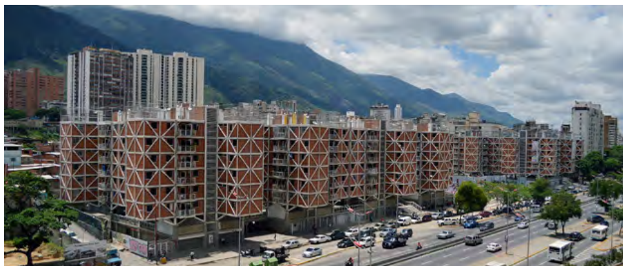
Figura 6. Viviendas en Avenida Libertador. Alcaldía de Caracas.

Entre estos ejemplos, de mucha mayor calidad que en todas aquellas hechas por el Estado o la empresa privada, en los 30 años anteriores, es posible mencionar los conjuntos de viviendas ubicados en el tejido central de la ciudad, en la avenida Bolívar, en el distribuidor La Hoyada, en Colinas de Santa Mónica, en la urbanización Montalbán, de la OPPPE; y en la avenida Andrés Bello y la avenida Libertador, de la Alcaldía.