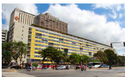
Figura 2. Viviendas en Distribuidor La Hoyada, construidas por la OPPP. Fotografía de los autores, 2019. Figura 3. Viviendas en Colinas de Santa Mónica, construidas por la OPPP. Fotografía de los autores, 2019. Figura 4. Viviendas en Urbanización Montalbán, construidas por la OPPP. Fotografía de los autores, 2019. Figura 5. Viviendas en Av/ Bolívar, construidas por la OPPP. Fotografía de los autores, 2019.