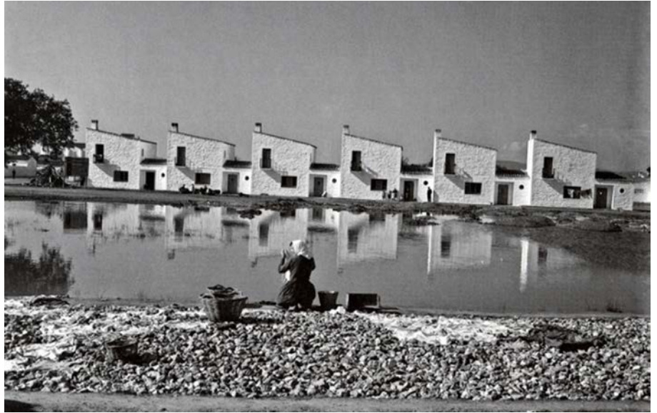
Figura 5a, 5b y 5c. Joaquín del Palacio-Kindel. Espacios urbanos y contexto territorial de Vegaviana (1954).

15 José Antonio Flores Soto, "Vegaviana. Una lección de Arquitectura", Cuaderno de notas 14 (2013): 31.