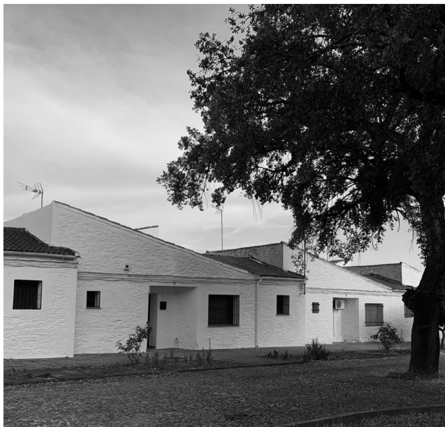
Figura 7. Imágenes actuales del espacio público y del tejido residencial en Vegaviana. Fotografías del autor, mayo 2020.

Podría decirse que el orden en Vegaviana se comporta como la más fuerte de las ideologías, su triunfo radica precisamente en que no necesita manifestarse para presentarse en su entorno de dominio, en el sentir colectivo y en cada acto cotidiano para determinar la acción del hombre, que tan sólo puede sentirse diminuto entre muros de mampostería encajada y encinas centenarias.